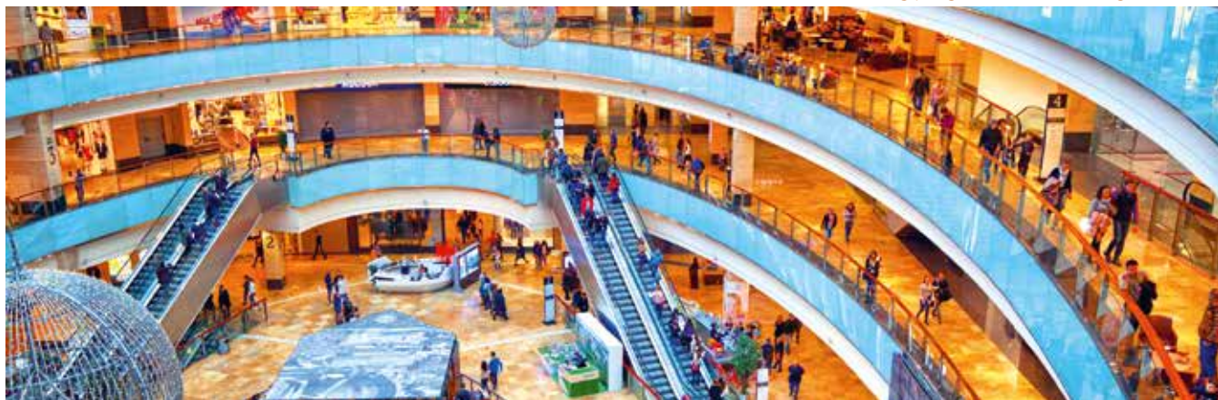
Распределение значений показателей обстановки с пожарами, произошедшими в Российской Федерации в 2016–2017 гг. на объектах торговли и сервисного обслуживания населения, по видам и результатам работы установок и систем пожарной автоматики