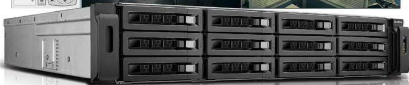
VS-12164U-RP Pro +