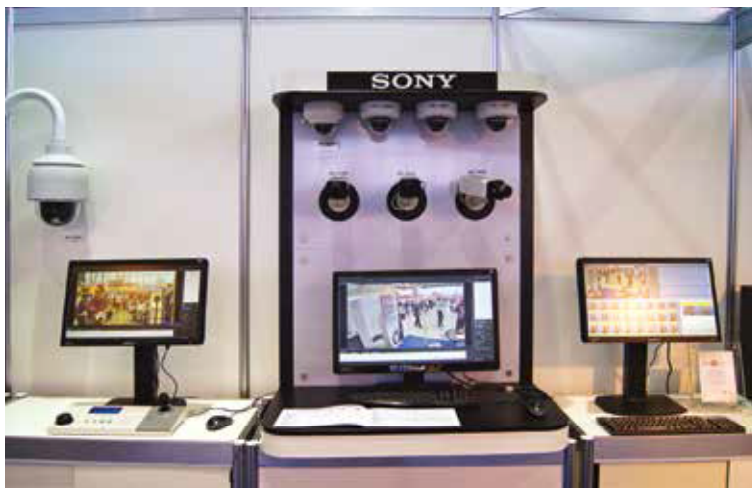
На выставочных стендах SONY были представлены новинки IP-камер 6-го поколения на основе платформы IPELA ENGINE

Кто хорошо работает, умеет хорошо отдыхать — таково неписаное правило неофициальной программы All-over-IP. В первый же день именинники из AxxonSoft устроили целое шоу с поеданием гигантского торта в собственную честь. Коллеги по рынку старались от них не отставать — какие наши годы. Изящной горкой из бокалов с шампанским «проставился» «ВИДЕОГЛАЗ», Axis устроил новую волну ваучеризации — по специальным купонам посетители могли отведать фирменный IP-мохито. Алкогольной кодой в этиодах на лояльность посетителей стала традиционная затея самих организаторов. Новый винный год от All-over-IP — под Божоле нуво и рок-н-рольный сейшен Ольги Олейниковой под аккомпанемент Emergency Band сделали свое дело. Равнодушных к IP-тенденциям в Сокольниках не осталось. Контракты на участие в 2014 году компании начали подписывать с организаторами еще до официального закрытия форума-2013.