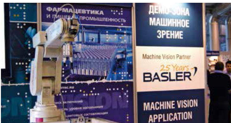
Машинное зрение — это применение компьютерного зрения для промышленности и производства

В итоге парад технологий на некоторых стендах свелся к ярмарке-распродаже: заявленные как новинки модели перебивали более матерых коллег по рынку всего лишь заниженной ценой в прайсе. При желании читатели могут провести собственную игру «Найди десять отличий», сопоставляя модельные ряды IP-камер и видеорегистраторов следующих компаний и брендов: Альгис (Sprutax) — Грумант — Аброн — Divitec, Samsung — Microdigital, Evidance — Beward, RVi — Infinity. Справедливости ради отметим: все же конечное сравнение будет полноценным только после детального изучения самих устройств и программного обеспечения. И самое главное, даже стагнация прорывных решений по итогам форума абсолютно укладывается в его концепцию — формировать и определять тенденции рынка охранного видеонаблюдения и смежных с ним.