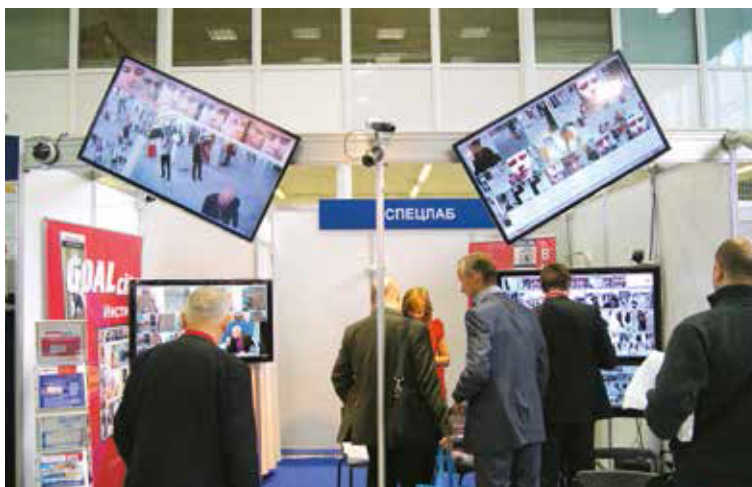
Без креатива на All-over-IP не обходится почти никто из участников