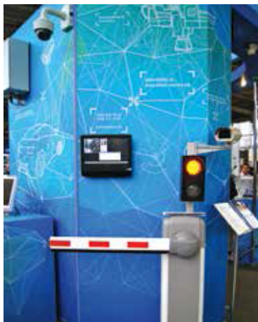
IP-решения сегодня можно встретить в самых различных сферах безопасности