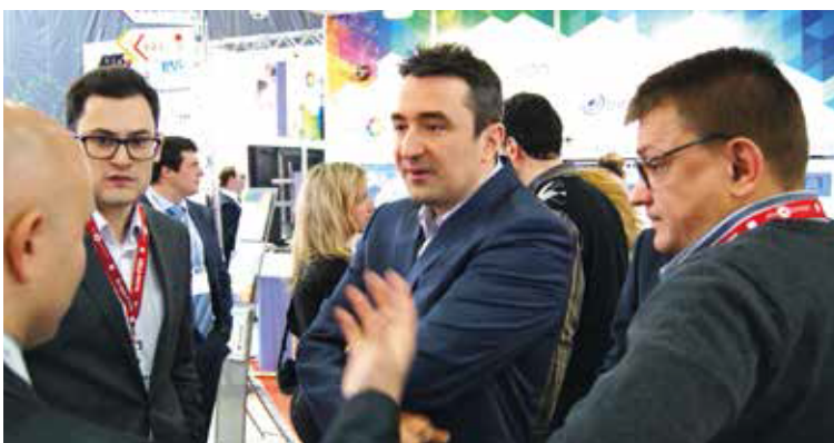
Президент ITV Мурат Алтуев традиционно в центре внимания коллег по рынку