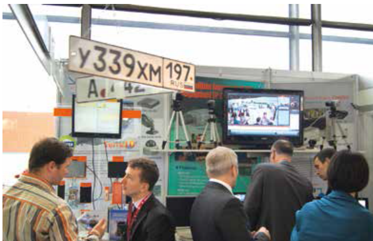
Распознавание автомобильных номеров — одно из ключевых направлений видеоаналитики, представленных в рамках All-over-IP