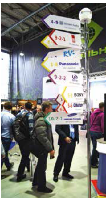
Ориентироваться в рынке IP-технологий с помощью All-over-IP довольно просто