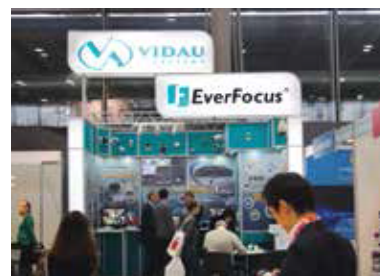
EverFocus представил полный спектр оборудования Full HD на стенде VIDAU SYSTEMS