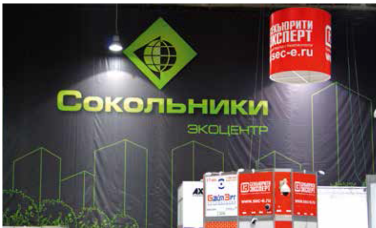
Сокольники стали традиционным местом проведения All-over-IP