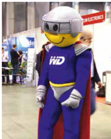
Western Digital поднимал настроение посетителям форума как мог. Но на All-over-IP трудно чем-либо удивить