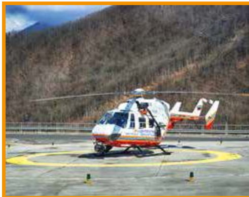
В МЧС создадут Единую горно-спасательную службу