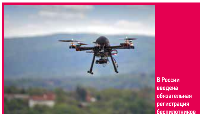
В России введена обязательная регистрация беспилотников