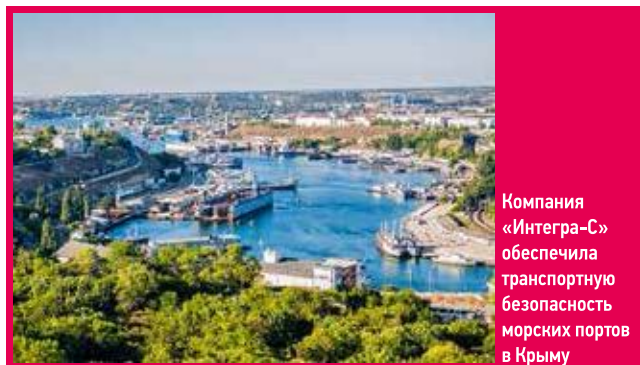
Компания «Интегра-С» обеспечила транспортную безопасность морских портов в Крыму