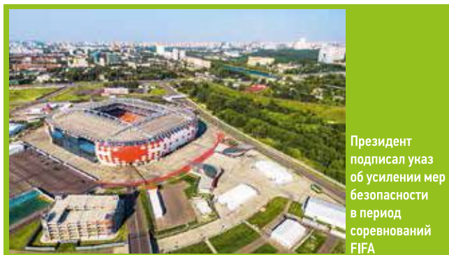
Президент подписал указ об усилении мер безопасности в период соревнований FIFA