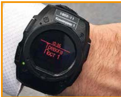
МВД и Росгвардия закупят браслеты «Стрелец-Часовой»