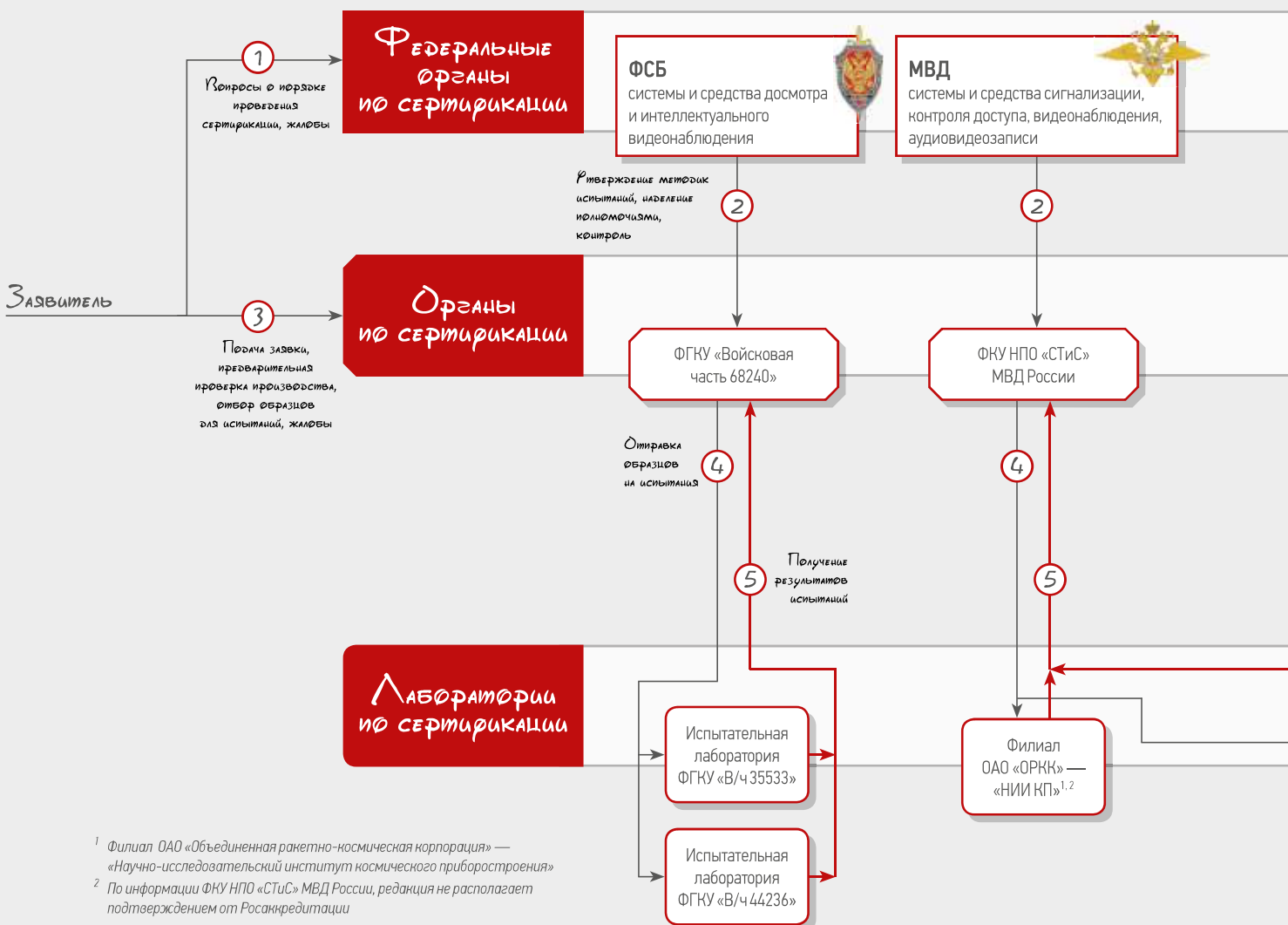
Схема сертификации по ПП № 969

In March 2017, the RF Government Decree No. 969 dated September 26, 2016 came into force, which endorsed the requirements for mandatory certification of transportation safety equipment. However, even a year later, a specific mechanism for implementing the decree remained unclear. The RUBEZH magazine prepared a detailed scheme for passing the certification, as well as an up-to-date certificate register.