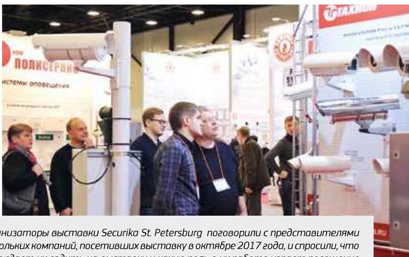
Организаторы выставки Securika St. Petersburg поговорили с представителями нескольких компаний, посетивших выставку в октябре 2017 года, и спросили, что побуждает их ездить на выставку и какую роль в их работе играет посещение таких мероприятий

Наличие на рынке центральной отраслевой выставки всегда ставит под вопрос востребованность региональных. Обычно при этом на выставку смотрят глазами участника: масштаб экспозиции, сколько будет посетителей, суммы потенциальных контрактов? Зачастую при этом упуская из виду мнение людей, для которых проводятся эти выставки. Предлагаем посмотреть на региональную выставку Securika St. Petersburg глазами посетивших ее специалистов — представителей предприятий, заинтересованных в поиске поставщиков и закупках продукции для обеспечения безопасности.