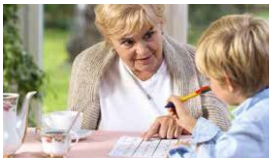
Комплекты для видеонаблюдения за няней