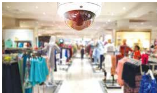
Комплекты для видеонаблюдения в магазине