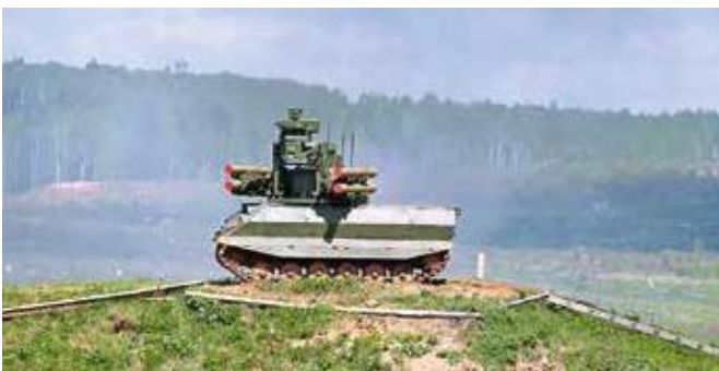
Бронетехника демонстрирует возможности