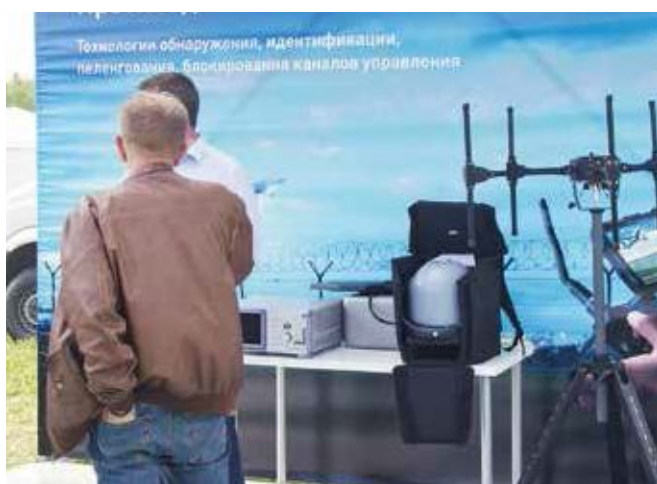
Кластер «Системы и средства информационного управления и радиосвязи, специальная радиоэлектроника» был представлен более 380 изделиями, в том числе комплексами противодействия беспилотным летательным аппаратам, системами видеонаблюдения, мобильными пунктами досмотра, экспресс-анализаторами наркотических веществ и металлодетекторами

ражение вице-премьера Дмитрия Rogozina) бойцы спецназа, в распоряжении которых лучшие технические средства, огнестрельное и нелетальное оружие, бронированные машины, катера, дроны, вертолеты и боевые роботы.