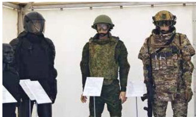
Производители представили более 500 комплектов одежды и обуви для экипировки военных

На кластере «Тыловое обеспечение. Экипировка. Строительство» производители показали более 500 комплектов одежды и обуви, свыше 100 видов экипировки военнослужащих, более 50 различных видов палаток, мобильные полевые бани и кухни, спорткомплексы для занятий в полевых условиях. Кроме того, гости выставки ознакомились с новейшими средствами охраны АЭС и флота, дирижаблями и беспилотниками, снайперским оружием и робототехникой.