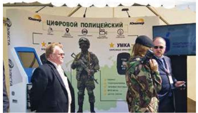
Компания «Элеста» представила новый охранный комплекс «Цифровой полицейский» с мобильным видеорегистратором, охранным ГЛОНАСС-браслетом и мобильным приложением с подробными картами местности для групп задержания

В завершение мероприятия специальные подразделения МВД и Росгвардии провели демонстрационные учения со зрелищным показом боевых возможностей образцов вооружения