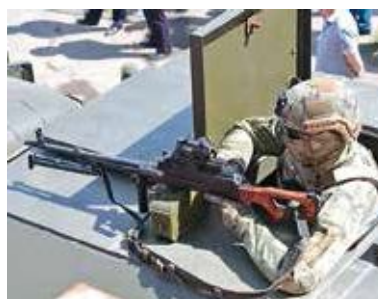
Дмитрий Rogozin уверен, что «вооруженные до зубов» бойцы Росгвардии и спецназа не пропустят ни одного террориста

Научно-технический форум Росгвардии показал, каким будет уровень оснащения самого воюющего внутри России подразделения — высочайшим. Чтобы у террористов не осталось никаких иллюзий на этот счет. Им будут противостоять «вооруженные до зубов» (вы-