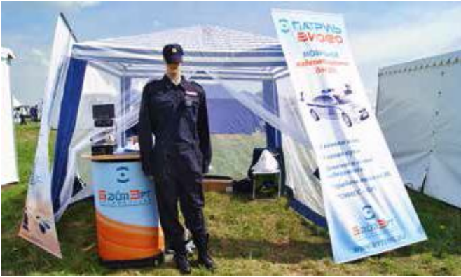
«БайтЭрг» привез в Красноармейск систему мобильного наблюдения для ДПС «Патруль Видео» с привязкой к ГЛОНАСС-GPS