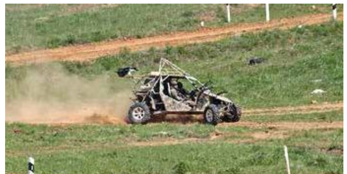
Боевые багги в действии