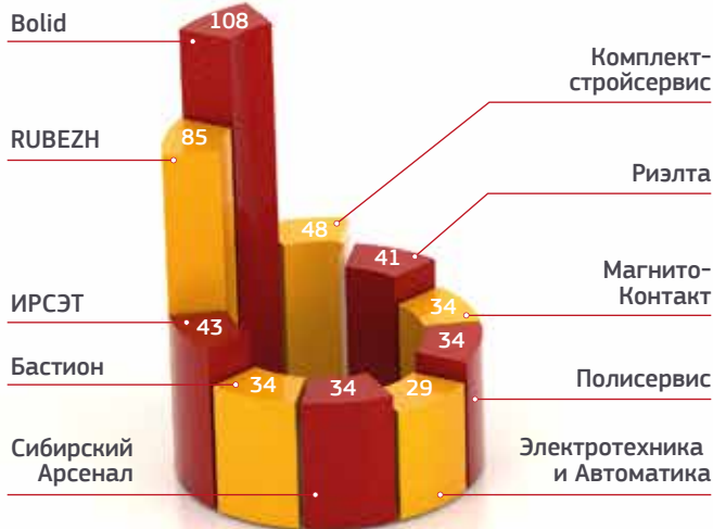
ТОП-10 самых популярных брендов ОПС (по количеству запросов в тендерной документации)