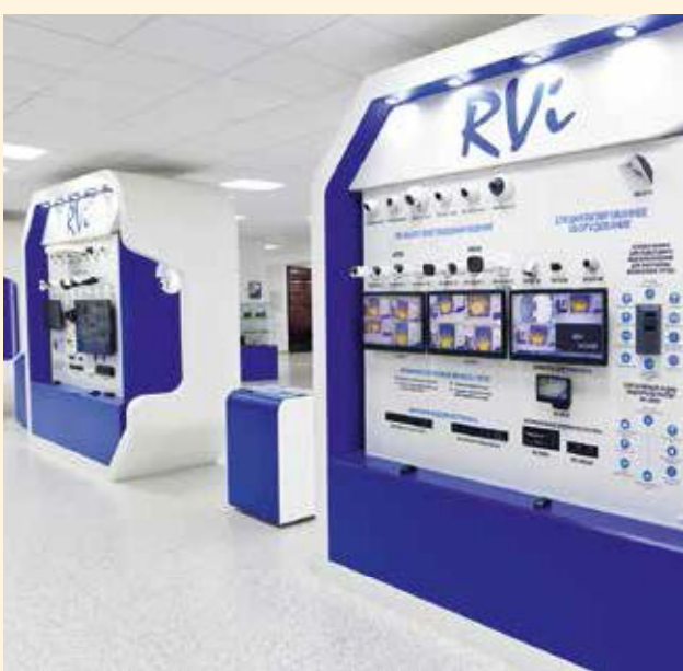
В ассортименте RVi — оборудование для различных типов объектов