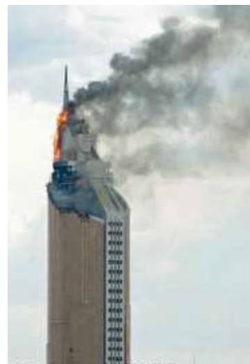
Пожар в Астане, 2006 год

Твоя деятельность теряет смысл, когда наталкиваешься на равнодушие или совершенно не обоснованный бизнес-интерес лиц, уполномоченных принимать решения.