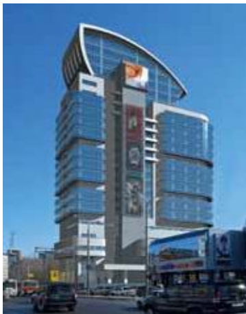
Многофункциональное торгово-офисное здание в Красноярске («Хамелеон»)