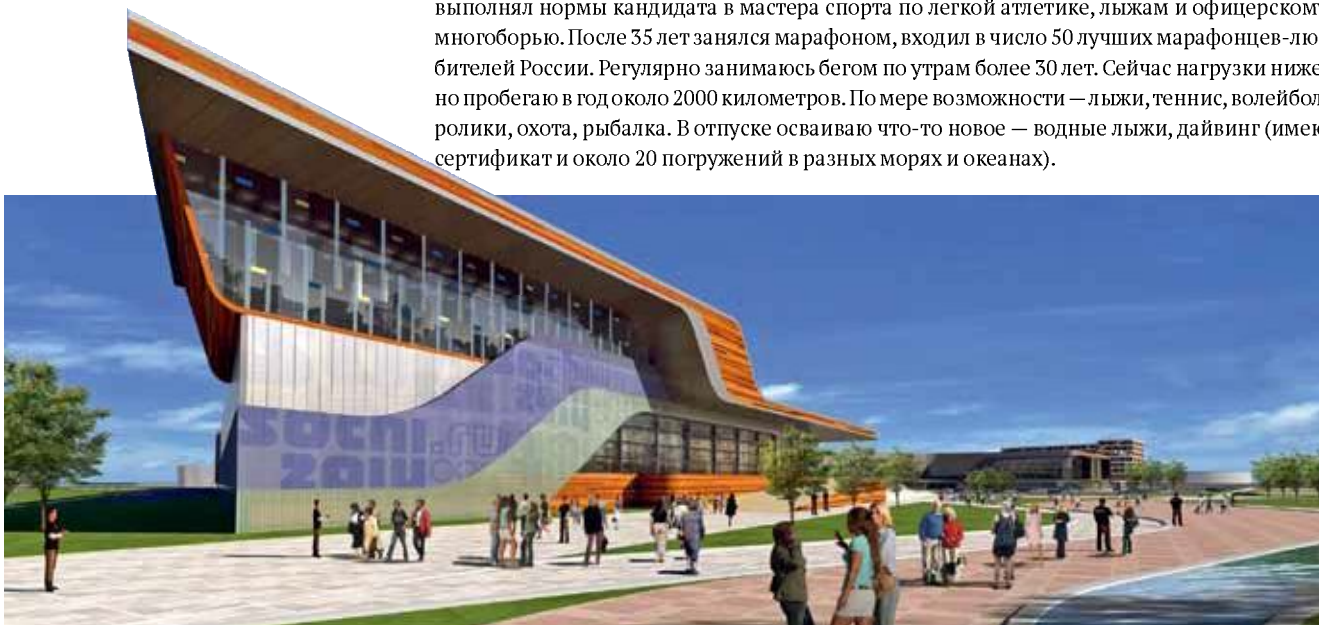
Главный медиациентр — олимпийская база в Сочи-2014

В фильмах стол руководителя обычно практически пустой. За много лет работы у меня никогда не было так. Я эксперт Минэкономразвития — мне присылают все проекты нормативных правовых актов. Например, вот — проект технического регламента Таможенного союза по безопасности зданий, сооружений, а рядом — аналогичный документ по требованиям к средствам обеспечения пожарной безопасности и пожаротушения, своды правил, стандарты. Необходимые материалы должны быть всегда под рукой.