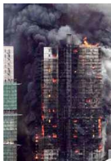
Пожар в Шанхае, 2010 год