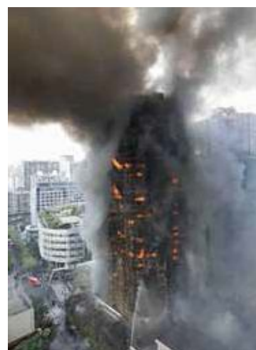
Пожар в гостинице в Барселоне, 2005 год