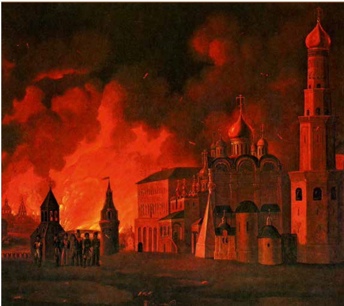
«Пожар Москвы». А.Ф. Смирнов, 1813 г.