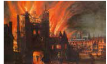
«Великий пожар в Лондоне». Неизвестный автор, ок. 1670 г.