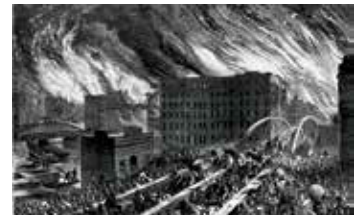
Великий чикагский пожар